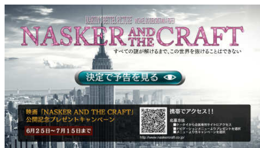
BD CONNECT-LITE 実装画面例 ポータルページ(左)、キャンペーンページ(右)